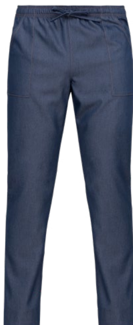
J004 Jeans blu